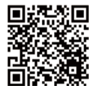
手機看政務司司長的嘉許信。Shoot and view the letter from CS.