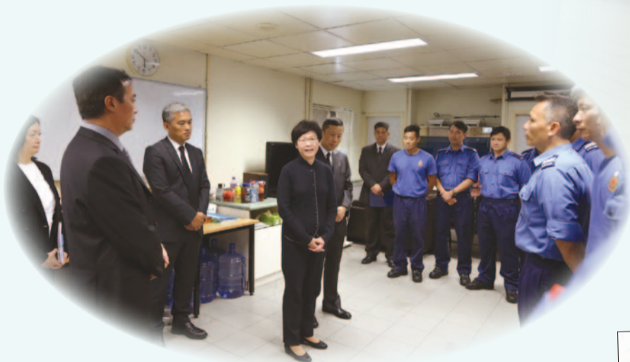
政務司司長林鄭月娥（左四）與消防人員會面，讚揚他們克盡己職的專業精神。The Chief Secretary for Administration, Mrs Carrie Lam (fourth left), meets with the fire personnel and commends them for their dedication and professionalism.